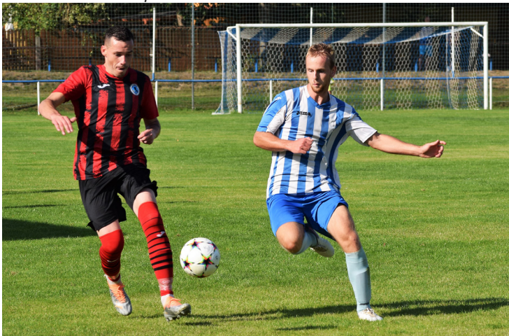
Snímek ze srpnového utkání Staňkov-Křimice.

Běčko zahájilo novou sezonu ve III. třídě v sobotu 16. září remízou 2:2 v Meclově. Oddíl jako tradičně obsadil i soutěže mládeže, a tak nám nezbyvá než věřit, že mezi žáky i dorostenci vyrůstají fotbalisté, kteří kromě toho, že zůstanou věrní modrobílým barvám klubu, se za nějaký čas opět poperou o návrat Staňkova mezi nejlepší celky plzeňského regionu.