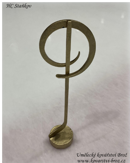
Putovní trofej pro klíčového hráče utkání