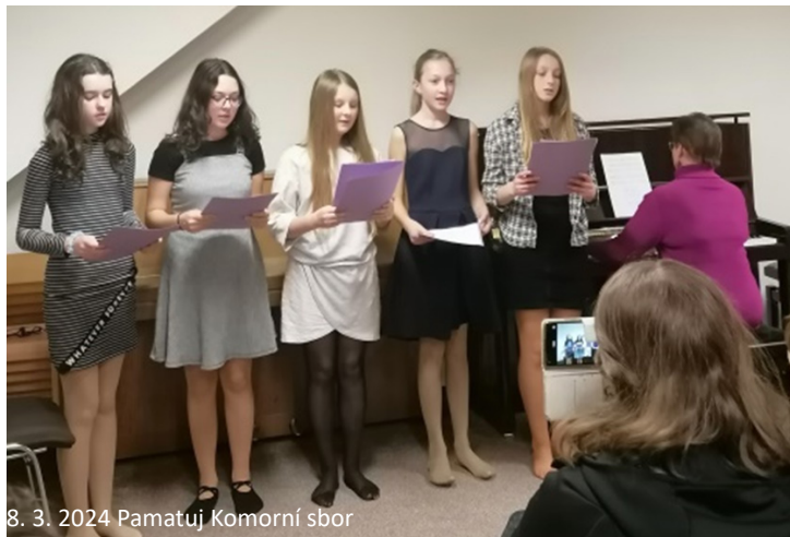
8. 3. 2024 Pamatuj Komorní sbor