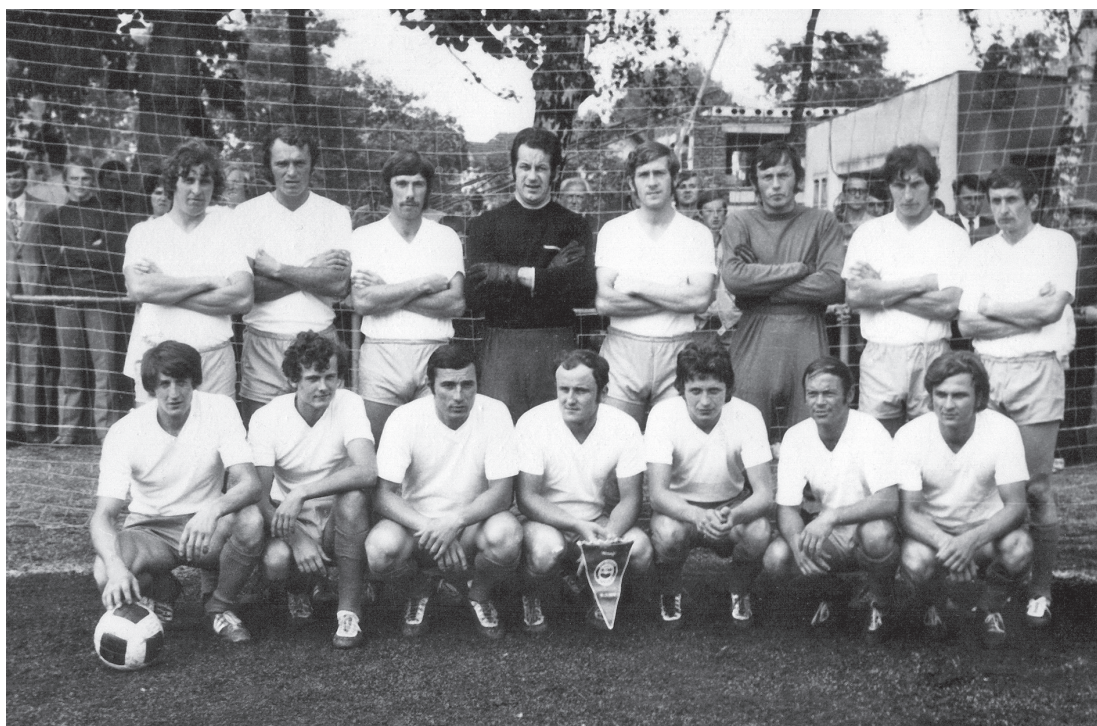
Foto: Fotbalisté Staňkova na snímku z července 1973.

Fotbalisté poté reprezentovali Staňkov úspěšně i v divizi, kde odehráli celkem čtyři sezony, přičemž nejlepším umístěním bylo 4. místo v roce 1973.