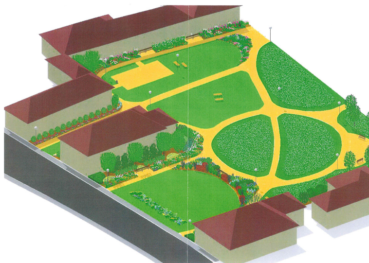
Bývalé uhelné sklady v Americké ulici