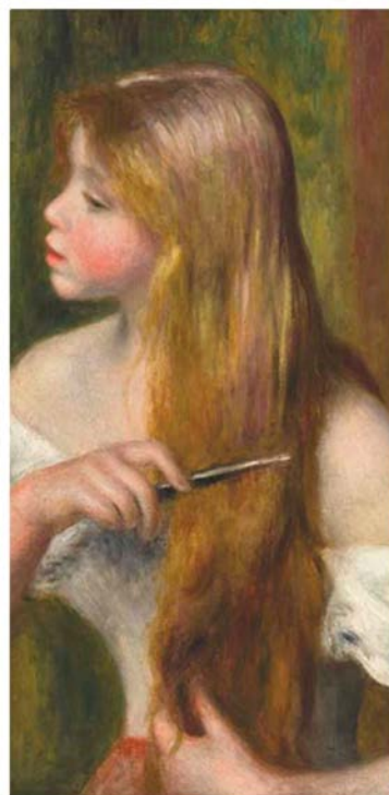
Elen Šobrová, Dívka česající si vlasy (Pierre Auguste Renoir)