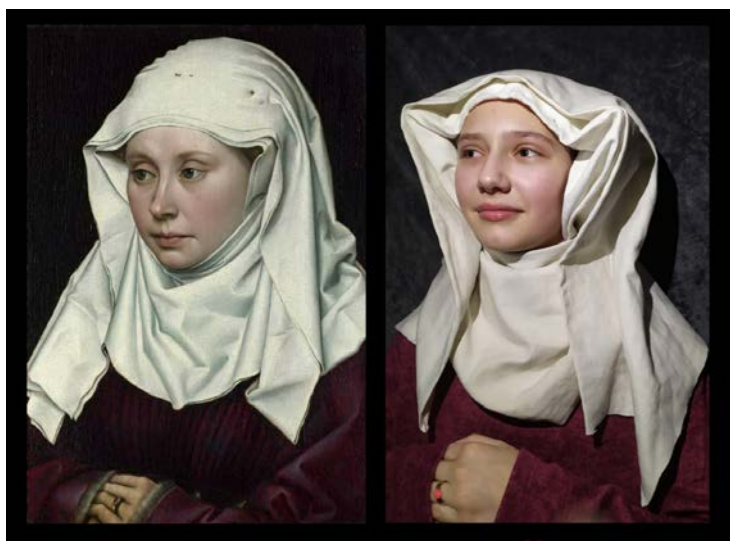
Adéla Ursová, Žena (Robert Campin)