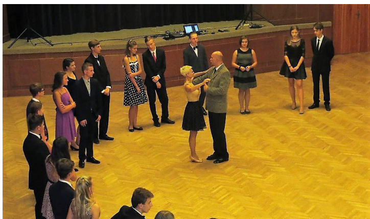
I letos probíhá v LD taneční kurz pod vedením manželů Cíchoých.