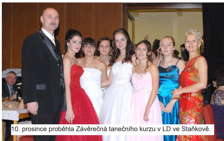
10. prosince proběhla Závěrečná tanečního kurzu v LD ve Staňkově.