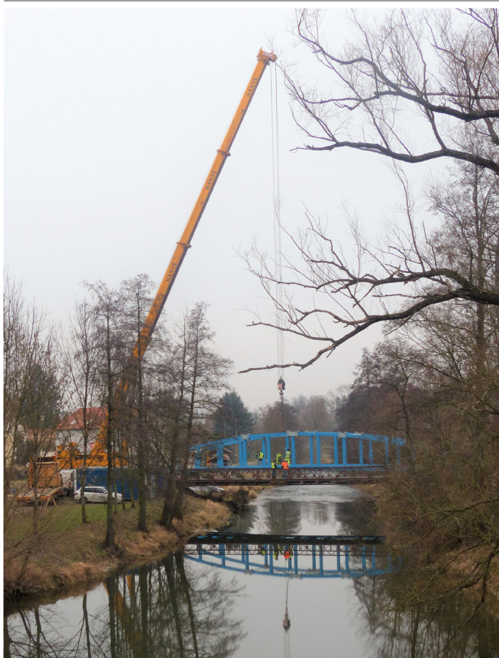
Těsně před Vánoci, 21. 12. 2016, byla za pomoci mohutného jeřábu usazena nová lávka přes Radbuzu...