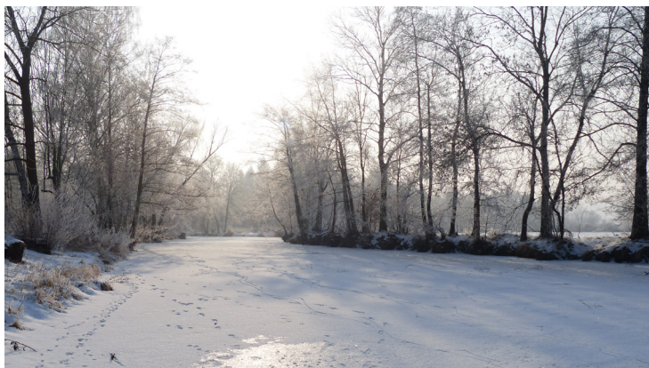
...a po Vánocích takhle usadila nové lávky sama naše Radbuza.