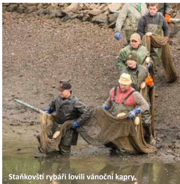
Staňkovští rybáři lovíli vánoční kapry.