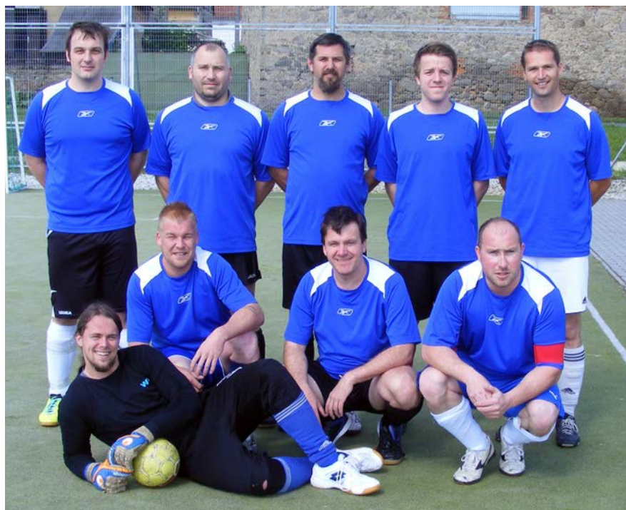
Snímek FC Ajax Staňkov B pořízený na jeho domácím hřišti ve Velkém Malahově.