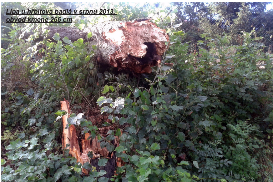
Lipa u hřbitova padlá v srpnu 2013. obvod kmene 266 cm

Každý poražený strom ve Staňkově vyvolává u některých občanů města silný odpor. Město poráží většinou stromy nemocné, přerostlé, bez možnosti dostupné úpravy a údržby. Stromy vysázené našimi předky jsou mnohdy krásné, ale na nevhodných místech (krajnice silnic, břehy potoků v zástavbě města, vysoké stromy