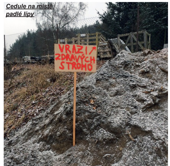
Cedule na místě padlé lípy