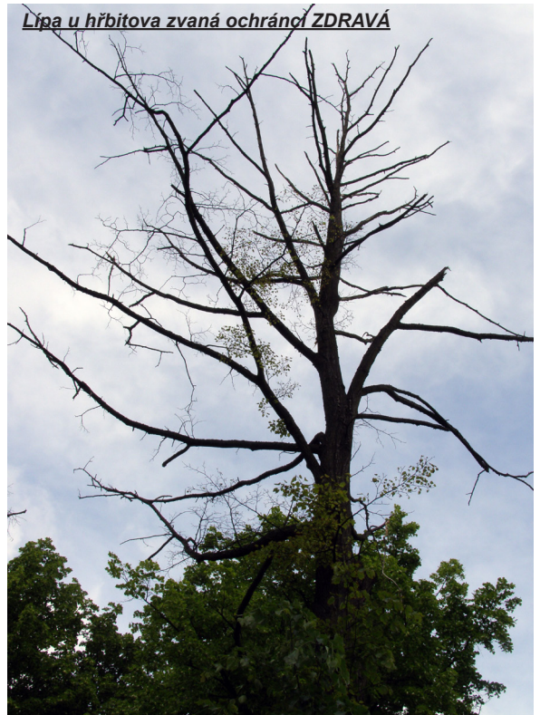
Lipa u hřbitova zvaná ochránčí ZDRAVÁ