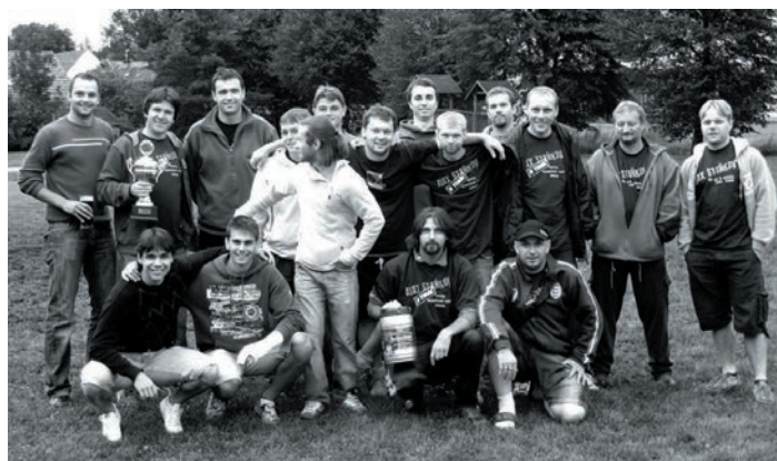
Část účastníků setkání Ajaxu Staňkov 18.7. v Hlohové