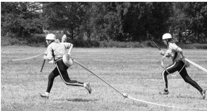
Útok děvčat z Poděvous

23. května se uskutečnil již 7. ročník soutěže v požárním útoku O pohár města Staňkov na louce za požární zbrojnicí. Bylo pěkné počasí. Soutěžila 2 družstva žen a 5 družstev mužů. Poměrně malá účast byla způsobena tím, že ve stejném termínu probíhaly hasičské okrskové soutěže v okolí. Každé družstvo měla dva pokusy, vyhrály ženy z Poděvous před ženami z Křenov, z mužů byli nejlepší hasiči z Vřeskovic před mužstvem z Křenov, třetí se umístilo družstvo pořadajícího sboru SDH Staňkov, následovalo družstvo z Vránova a Ohučova. Vítězové obou kategorií si putovní poháry odvezli domů, protože zvítězili potřetí.