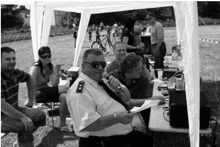
Na zdárném průběhu se podílely bývalé i současné opory staňkovských hasičů - moderoval p. Neznámý...

23. května se uskutečnil již 7. ročník soutěže v požárním útoku O pohár města Staňkov na louce za požární zbrojnicí. Bylo pěkné počasí. Soutěžila 2 družstva žen a 5 družstev mužů. Poměrně malá účast byla způsobena tím, že ve stejném termínu probíhaly hasičské okrskové soutěže v okolí. Každé družstvo měla dva pokusy, vyhrály ženy z Poděvous před ženami z Křenov, z mužů byli nejlepší hasiči z Vřeskovic před mužstvem z Křenov, třetí se umístilo družstvo pořadajícího sboru SDH Staňkov, následovalo družstvo z Vránova a Ohučova. Vítězové obou kategorií si putovní poháry odvezli domů, protože zvítězili potřetí.