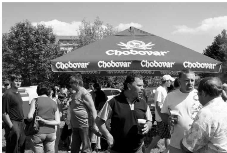
Hasilo se nejen vodou ze stříkaček.