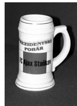
Tento korbel věnovali futsalisté svému dlouholetému šéfovi