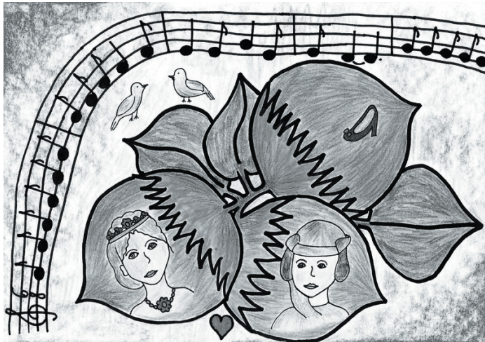
Vítězný obrázek od M. Augustinové