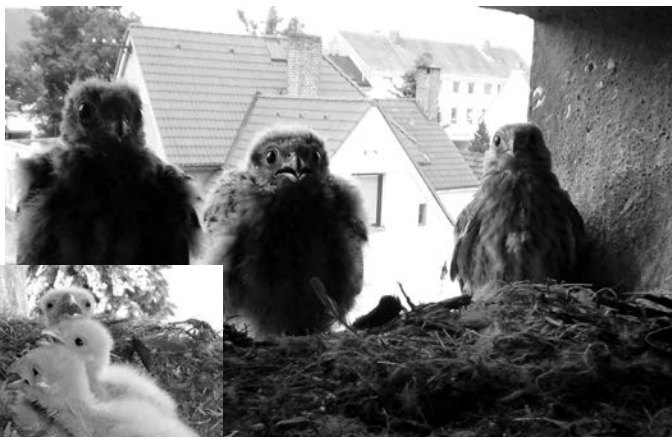
Pan Rudolf Chlíbec vyfotografoval mláďata poštolky v jednom ze staňkovských domů. Poznáte kde?

UPOZORNĚNÍ NA STRÁNKÁCH STAŇKOVSKA JE MOŽNO UVEŘEJŇOVAT INZERÁTY NEBO PROPAGOVAT SVOJI FIRMU NA PRVNÍ STRÁNCE JAKO SPONZOR ČÍSLA. CENA ZA BĚŽNÝ INZERÁT JE 6 Kč/cm 2 , SPONZORSTVÍ ČÍSLA NA 1. STRANĚ STOJÍ 2000 Kč.