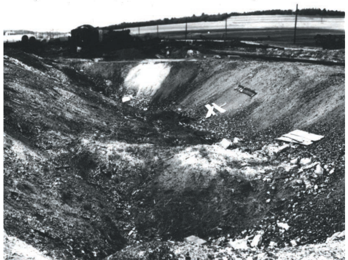
jáma v kolejisti po výbuchu muničního vlaku

Až na konci války, kdy už bylo málo lokomotiv, dva transporty uvízly ve staňkovském nádraží. Odstavili je na poslední koleje blízko k viaduktu silnice do Osvráčina. Nikdo, ani děti, k vagonům nesměl. Ale z dálky jsme viděli, jaký je nepořádek kolem vagonů, že kdo byl schopný, vystoupil, udělal potřebu a zase nastoupil. Neviděli jsme, zda jim dávali jídlo. Jen občas přijelo auto a mrtvé odvezlo. Jenže nestačilo nádraží. Skončil provoz trati do Poběžovic a tam odstavili další transporty.