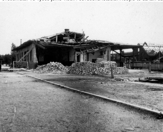
holýšovské nádraží krátce po bombardování

Až se to stalo! Jeden večer začaly kolísavě houkat sirény. Letecký poplach! U nás v domě ještě nebyly kryty, a tak všichni se běželi schovat do Čermenského lesíku. Slyšeli jsme zdáli směrem na Plzeň slabé výbuchy. Nebe se tam rozzářilo křížovaně pohybujícími se jasnými pruhy světlometů. Ve výšce jsme viděli i osvětlená letadla. Nebylo to až tak daleko. Druhý den jsme se dozvěděli, že bombardovali Dobřany, že to měl být nálet na Plzeň a že se asi spletli. Přelety (a tím i poplachu) svazů bombardovacích letadel byly častější. Naproti našemu domu od schodů doprava byl nevyužívaný sklad Šamotky. Uvnitř udělali narychlo hodně cihlových příček, bez stropů. To byl náš kryt. Střeška tohoto objektu i našeho domu byla prkenná, potažená lepenkou. Na chodbě u středu našeho domu byl železný velký kruh se železným kladivem. Kdo slyšel první houkat, tak také mohl zabouchat na kruh. Zvonilo to tak hlasitě, že při sebevětším hluku v bytě to bylo slyšet. A všichni museli do krytu.