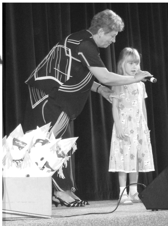
Druhého září bylo v Lidovém domě slavnostně přivítáno 34 prvňáčků.