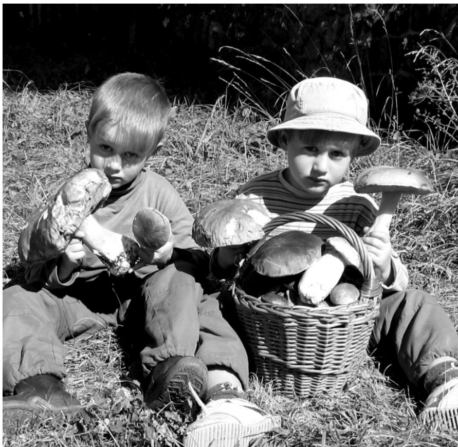
A potom, že nerostou...