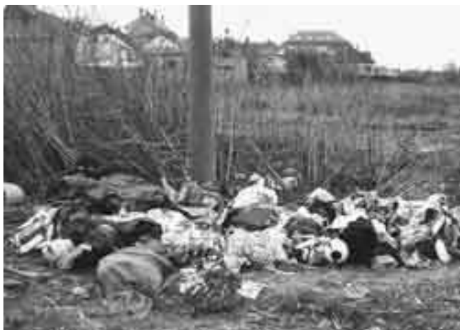
Na louce za školou