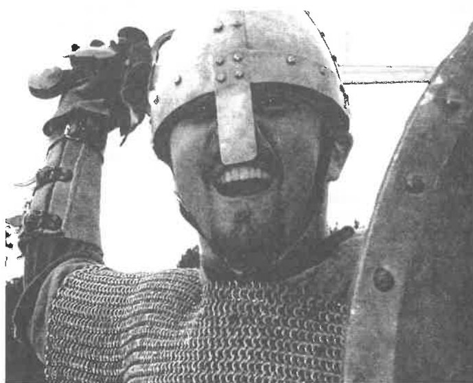
Kéž se podobné akce nejen nadále opakují, ale snad i množí. Ferdinand Schenk

Prostě, odpoledne, jak malované, a nebýt podvečerního slejváku, kdy vítr a dešť stejně spolehlivě rozehnal jak šermíře, tak obecnstvo, nebylo si na co stěžovat - snad jen na nepovedený jarmark, kdy se většina historických prodejců prostě nedostavila... Pro náročný historický den pokračoval večer v hospodě, kde se velice líbilo vystoupení s ohněm, a závěrečným ohňostrojem. Na závěr článku se sluší pěkně poděkovat pořadatelům a účinkujícím, kteří nám, ostatním, připravili pěkný zážitek. Kéž se podobné akce nejen nadále opakují, ale snad i množí.