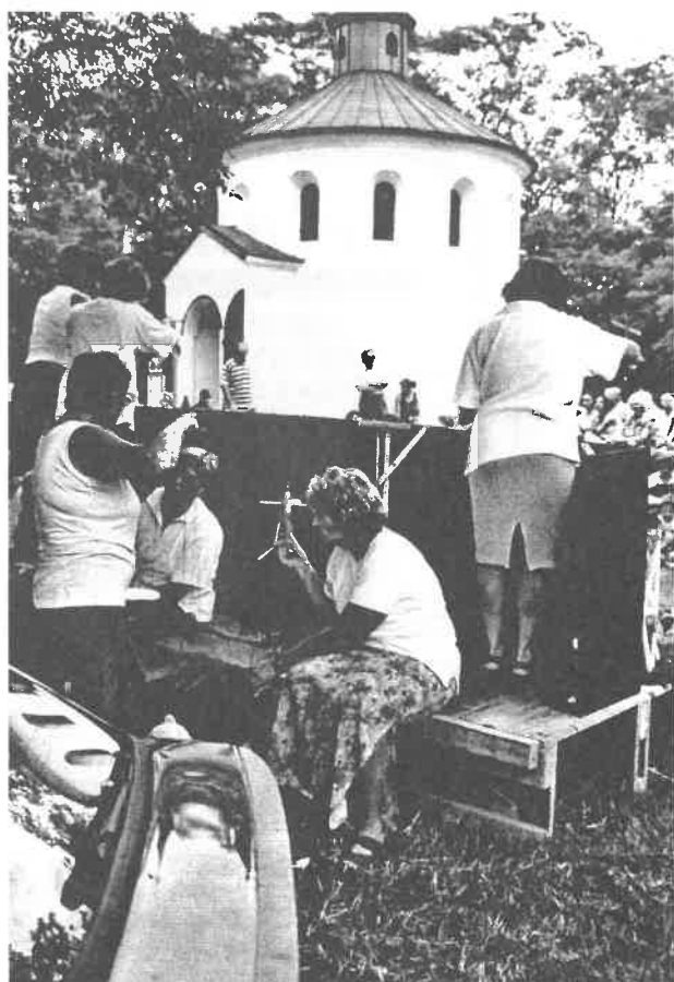
Dne 8.7. se už tradičně konalo setkání u kapličky, tentokrát s tématem „dítě“. Celé odpoledne, které bylo moc fajn publiku zpříjemnilo představení loutkového divadla, Svatojakubského chrámového sboru a vystoupení orchestru při lidové škole umění ve Staňkově.