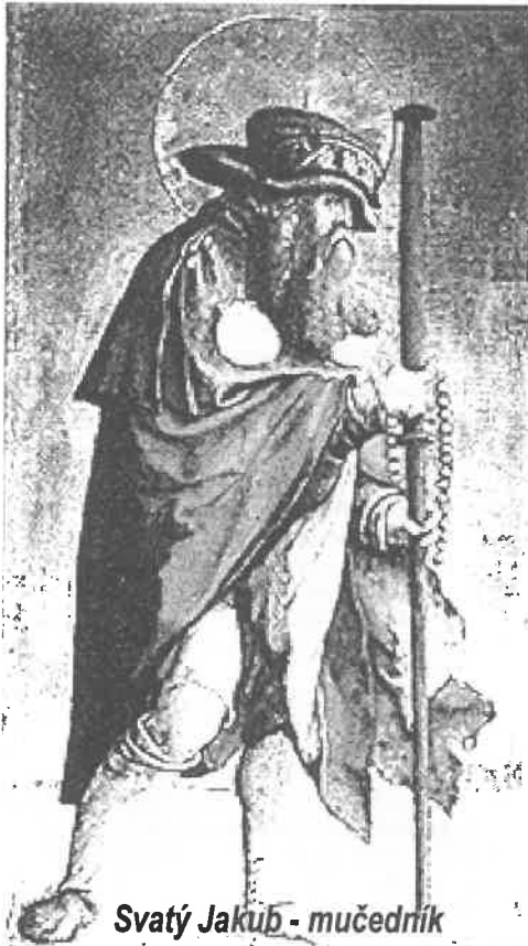
Svatý Jakub - mučedník

V době, kdy v Jeruzalémě žil sv. Jakub, byl v Palestině králem Marcus Iulius Agrippa Herodes; Herodes Agrippa I. Jaký to byl člověk a jaký to byl král?