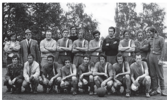
Fotbalisté Sokola Staňkov v roce 1973. Snímek z knihy Když hrál Staňkov divizi, která nejslavnější období zdejšího fotbalu podrobně popisuje.