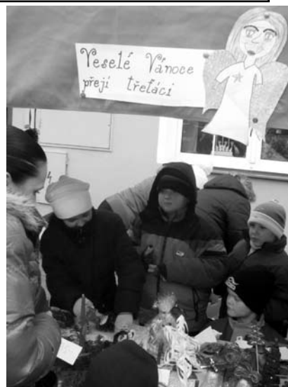
9. 12. se opět konaly vánoční trhy v prostoru před restaurací Na Mlýnské. Opět se akce povedla, tak snad zase napřesrok!