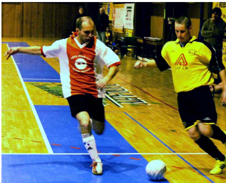
Z utkání futsalové divize Ajax-Draci Karlovy Vary.

Do finišu míří futsalová divize, kam se po roce vrátil Ajax Staňkov. Jako nováček si nepočínal vůbec špatně, v polovině soutěže dokonce bojoval o nejvyšší příčku, a přestože poté přišlo několik zaváhání, místo v nejužší špičce soutěže si zajistil. Poslední kolo Ajax odehraje 3. března v Plzni s tamními týmy Amigos Bar a Motáček. vis