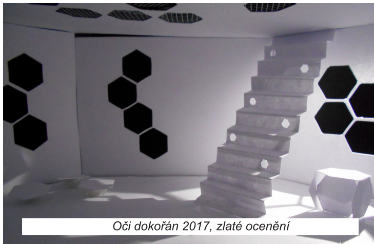
Oči dokořán 2017, zlaté ocenění