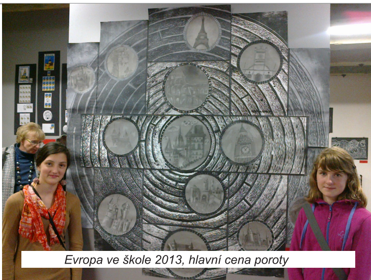
Evropa ve škole 2013, hlavní cena poroty