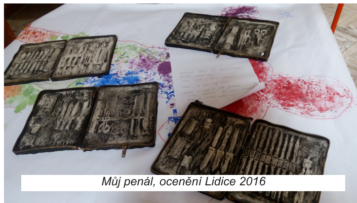
Můj penál, ocenění Lidice 2016